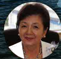
前滋賀県知事 嘉田 由紀子